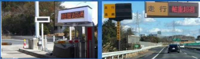
高速道路本線での「軸重超過」表示