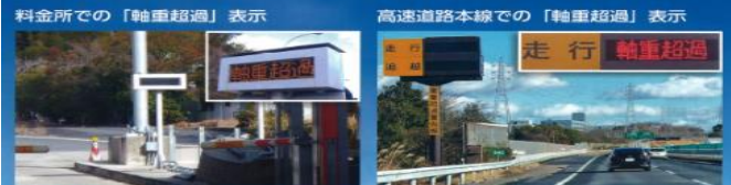
※「重量超過」という表示が一部あります。今後「軸重超過」に統一します。

また、繰り返し「軸重超過」と確認された場合、高速道路の大口・多頻度割引制度での違反点数を科す場合があります。